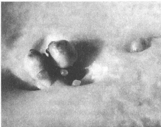
Рис. 1. Блистерный жемчуг на внутренней стороне створки приморского гребешка

В исследованных моллюсках встречался как истинный жемчуг в виде горошин различных форм, так и причудливый, блистерный жемчуг, одной стороной приросший к раковине. Блистерный жемчуг встречался не очень часто и в основном у приморского гребешка (рис. 1). Доля такого жемчуга составила только 3,4% от всего обнаруженного у приморского гребешка.