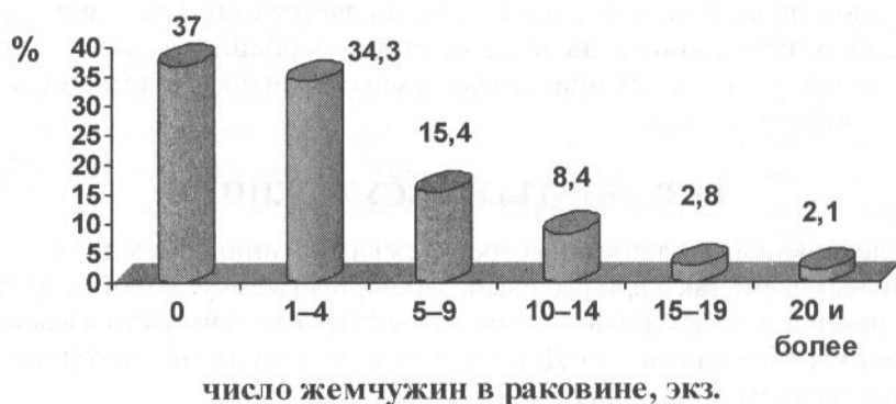
Рис. 2. Распределение жемчуга у приморского гребешка (N=143 экз.)

Всего 37% всех исследованных гребешков были свободны от жемчуга. Из пораженных чаще встречались моллюски, в раковинах которых было от одной до четырех жемчужин, и доля таких гребешков составила 34,3% (рис. 2). Моллюски, содержащие пять и более жемчужин, составляли 28,7% от всех осмотренных.