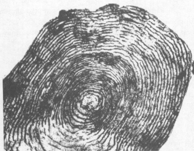
Рис. 2. Чешуя пресноводного кижуча оз. Гольгинского. Возраст 3+, длина 24 см, самец, декабрь 2005 г.

оз. Гольгинское формируется в результате характера питания — переходе с бентосных организмов исключительно на хищничество после достижения определенной длины и независимо от возраста. В желудках у рыб всех возрастных категорий в декабре — 100-процентная встречаемость колюшки трехиглой.