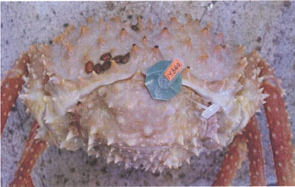
Рис. 2. Метка, закрепленная в мускульном тяже между абдоменом и карапаксом равношипового краба. Fig. 2. A tag attached to the muscular band between abdomen and carapace of the golden king crab.

Около 45% помеченных крабов составляли особи с неокрепшим панцирем на 2-й стадии линочного цикла. Мечение таких особей позволяло оценить продолжительность межлиночного периода. Стадии линочного цикла определяли согласно стандартной методике. Третью, наиболее протяженную стадию линочного цикла (твердый панцирь) подразделяли на раннюю, среднюю и позднюю подстадии (Михайлов и др., 2003; Карасев, 2004). Основным параметром, используемым для различения подстадий равношипового краба, являлся внешний вид клешни и исчерченность когтей перейопод.