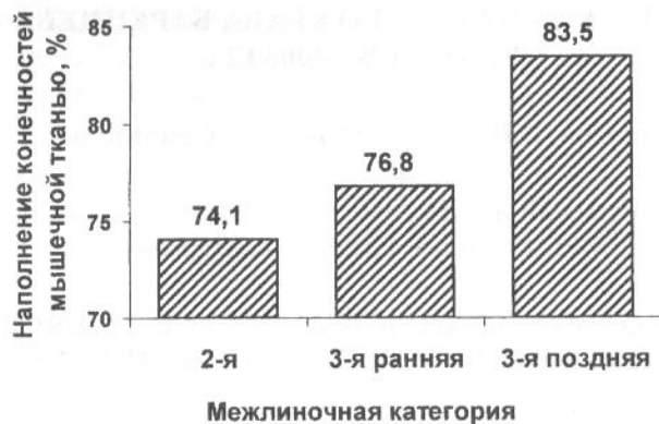
Рис. 3. Среднее НКМТ у крабов разных межлиночных категорий в ноябре 2005 г.

Среднее НКМТ у промысловых самцов межлиночной категории "3-я поздняя" составляло 83,5 \pm 0,8 %, что значительно, на 8,0 %, превышало эту характеристику крабов 2-й межлиночной категории. Значение среднего НКМТ крабов 3-й ранней межлиночной категории занимало промежуточное положение. Следовательно, начиная с момента затвердевания покровов после линьки, наполнение конечностей увеличивается постепенно, со старением панциря. Наилучших технологических показателей (наименее водянистые мышцы, наибольший показатель наполнения) краб-сырец достигает зимой, когда его панцирь уже достаточно старый. Полученные данные подтверждают выводы норвежских ученых [Hjelset A.M., Sundet J.H., 2004] и свидетельствуют о том, что наивысший показатель наполнения камчатского краба наблюдается в зимний период, предшествующий началу линочных процессов.