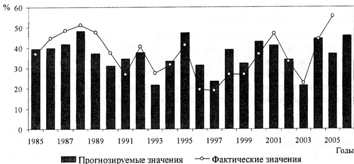
Рис. 1. Прогнозируемые и фактические значения доли ставриды (%) в уловах российских судов в ИЭЗ ИРМ в 1985-2006 гг.

промысел в водах ИЭЗ ИРМ лишь по август, а в дальнейшем на лову находилось 1-2 траулера. И кроме этого, часть судов систематически не давали сведений о результатах своей работы. Все это искажало истинную промысловую ситуацию.