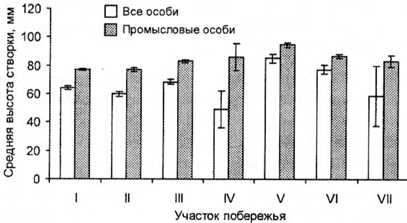
Рис. 2. Средняя высота створок ( \pm стандартная ошибка) гребешков в верхней сублиторали Кольского п-ова (с запада на восток).

Наибольший средний размер гребешков был отмечен в районе архипелага Семи Островов, наименьший – в районе о-ва Большой Олений. Средний размер промысловых особей возрастал с запада на восток от Варангер-Фьорда до Семи Островов (там он был максимальным), и далее снижался (рис. 2).