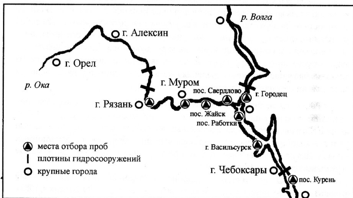
Рис. 1. Карта-схема района проведения исследования. Обозначены только географические названия, упоминаемые в тексте.

Места отбора проб в интересующем нас районе представлены на рисунке 1. Ранее было показано, что альбуминовая система стерляди детерминирована тремя аллелями одного локуса (Кузьмин, Кузьмина, 2005). В обсуждаемых выборках мы встретили пять из шести теоретически возможных генотипов, фактические распределения которых приведены в таблице. На рисунке 2 представлены дендрограммы, построенные по результатам кластерного анализа 15 выборок стерляди по пяти тестируемым индексам.