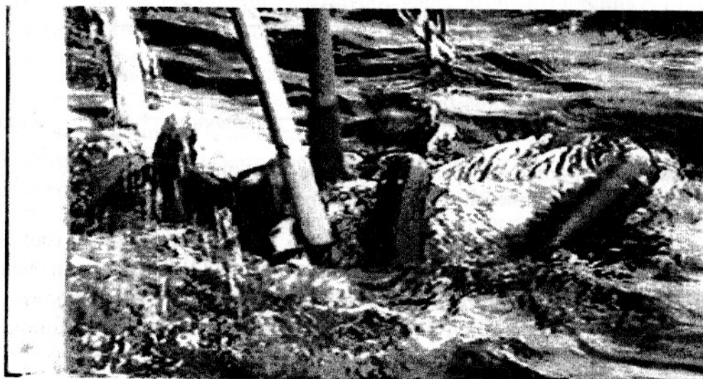
Рис. 2. Антарктический клыкач в «объятиях» глубоководного кальмара.

характерная для Mesonychoteuthis hamiltoni .