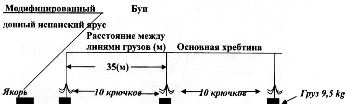
Рис. 1. Схема конструкции модифицированного донного испанского яруса.

сложных промысловых участках и на больших глубинах моря Росса. Конструкция донного яруса, на который 4 февраля 2005 г. с глубины 1 480 м в восточной части моря Росса был поднят на поверхность антарктический клыкач, захваченный крупным кальмаром показана на рисунке 1. Ярус был выставлен в следующих координатах: начало постановки – 75°55'S, 166°26'W, конец – 75°57'S, 167°16'W, глубина 1 505-1 090 м. В качестве наживки использовались сардины, собранные в пучок по 10 штук, длиной 18-20 см, наживляемые вручную.