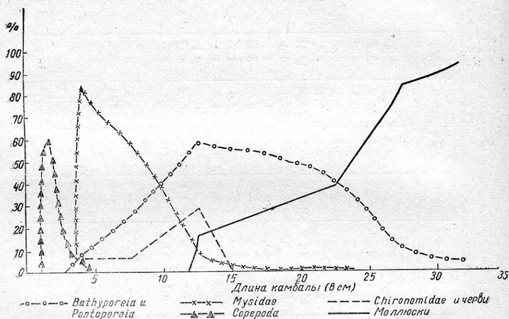
Рис. 1. Изменение состава пищи речной камбалы по мере ее роста.

тельных соков. Створки выбрасываются вместе с каловыми массами наружу. Несколько по-иному используются Муа: крупная камбала захватывает Муа, как и других моллюсков, целиком и раздробляет их; мелкая камбала использует часто только одни сифоны Муа 1 , вероятно, отрывая их от самого моллюска. В кишечных трактах мелких (длиной 10—12 см) камбал в некоторых случаях оказывалось свыше 40 сифонов Муа при полном отсутствии створок этих моллюсков; наоборот, у крупной, более 30 см длины камбалы, пища состояла из заглоченных целиком и раздробленных впоследствии моллюсков. По мере роста камбалы увеличивается также и длина моллюсков, используемых ею в пищу; наиболее крупная Муа (3,5 см длиной) была обнаружена у камба-