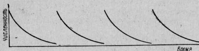
Рис. 3. Схема колебаний численности моночастотной популяции.

Поличастотная популяция с однократным актом воспроизводства — это популяция, в которой особи воспроизводят потомство в различном возрасте, но один раз в своей жизни (например, речной угорь Anguilla anguilla Linné, дальневосточные лососи рода Oncorhynchus и др.).