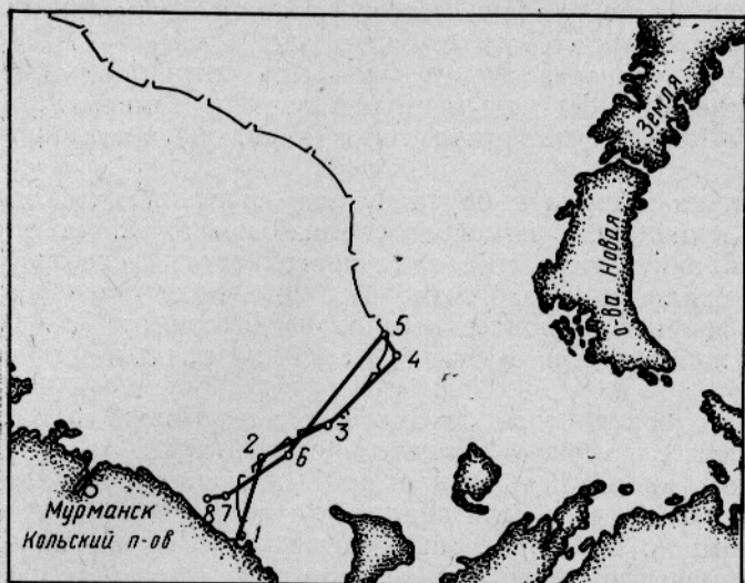
Рис. 1. Карта-схема работ СРТМ «Икар» в Баренцевом море в апреле — мае 1969 г.

— среднегодовая граница кромки льдов март (Морской атлас, т II, 1953г)