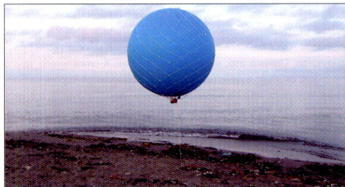
Фото 1. Резиновый шар. Диаметр 120 см, грузоподъемность 650 г. Видна прикрепленная к оплетке пластмассовая оправка для фотоаппарата

Мы надеемся, что данная методика найдет применение в научной и практической деятельности работников рыбного хозяйства.