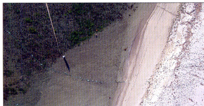
Фото 2. Взморье Охотского моря. Видны ставная сеть с пойманной кетой, а также оператор, держащий линию воздушного шара. В кадр попали также крупные медузы