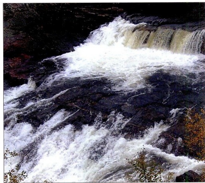
Фото 2. Верхняя ступень 2-го водопада