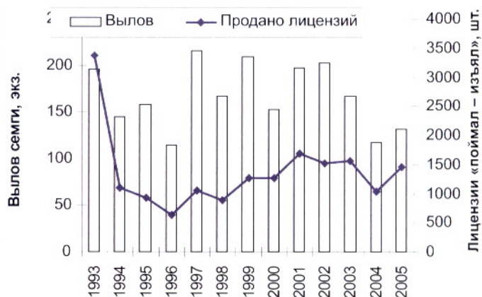
Рис. 2. Результаты лова по принципу «поймал – изъезд»

Средняя численность нерестовой части популяции семги р. Титовка оценивается на уровне 800 экз., средняя ежегодная продукция НВУ – около 9 тыс. смолтов. Воспроизводство осуществляется на участке реки между четвертым километром от устья и первым водопадом, где находится более 10 га НВУ. Здесь преобладают ровные перекаты (63 %) и пороги (37 %). На перекатах грунт галечниковый, с глиной и песком, крупные каменистые фракции встречаются реже, главным образом, на порогах. Плотность расселения выше в многослойном валунно-галечном субстрате (0,6–1 экз/м 2 ), чем в гальке (0,3–0,5 экз/м 2 ). Следует отметить, что на контрольных выростных участках за период наблюдений (2001 – 2006 гг.) наблюдается тенденция снижения плотности расселения молоди семги с 0,5–0,6 экз/м 2 до 0,25–0,35 экз/м 2 . Это, по-видимому, связано с недостатком произведе-