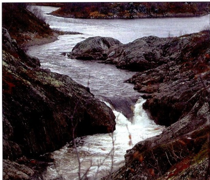
Фото 3. 3-й водопад

The Titovka River is one of the most popular salmon rivers in Kola Peninsula. However, because of waterfalls spawning grounds are beyond the reach of Atlantic salmon and thus, the river potential is not fully used. A step towards rational and profitable angler tourism in the river, in the authors' opinion, may lay in increase of salmon abundance. At present, the mean annual abundance of the spawning population is estimated at 800 individuals, and the annual production of spawning and nursery grounds makes up nearly 9 000 smolts. Natural reproduction takes place only at 10 hectares situated below the first waterfall impassable for fish. High-quality spawning and nursery grounds are located between the first and second waterfalls. The mean potential production of this part of the river is estimated at 11 000 smolts (the resulting increase of the spawning population is about 1000 adults). So, it is proposed to release hatchery juveniles there. To make these areas reachable for spawners it is offered to build a fishway bypassing the first waterfall. These actions, along with effective measures for the river conservation, will lead to the enhanced natural reproduction and sustainable population abundance at higher level. This will make the river more attractive and contribute to development of angler tourism.