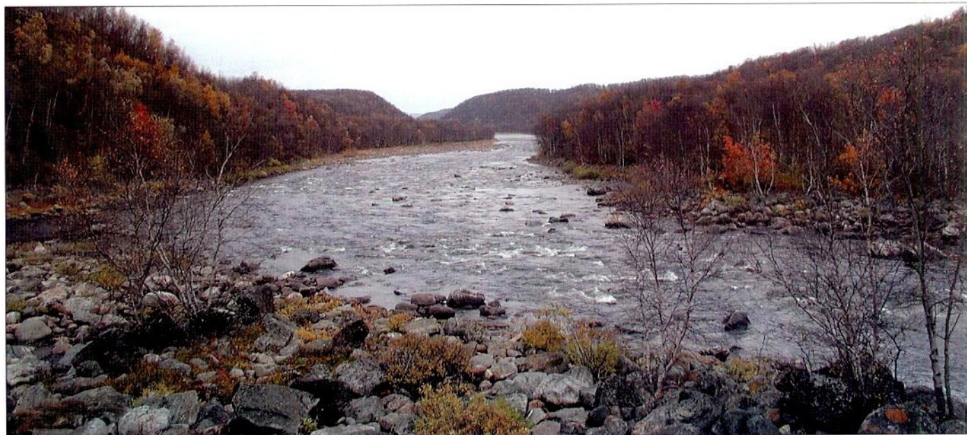
Фото 4. Нерестово-выростные угодья, расположенные ниже 2-го водопада