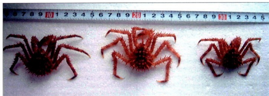
Фото 2. Мальки с донной плантации у островов Рикорда – Пахтусова

[Клитин А.К. Распределение и некоторые особенности биологии камчатского краба у юго-западного побережья Сахалина// Промыслово-биологические исследования морских беспозвоночных. М.: ВНИРО, 1992. С. 14–26].