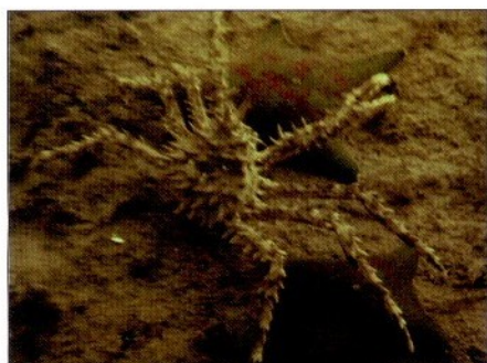
Фото 1. Малек на донной плантации у островов Рикорда – Пахтусова

Известно, что первые три года жизни мальки проводят на водорослях и в защищенных от хищников местах, а затем переходят на открытый грунт. Подобные концентрации молоди на отдельных участках, по нашим данным, в зал. Петра Великого могут достигать 1000 экз. [Разработка технологий садкового выращивания краба. Данные по искусственному осажению и подращиванию личинок краба на коллекторных установках: Отчет о НИР/ТИНРО. Исполн.: Федосеев В.Я., Вдовин А.В., Григорьева Н.И. и др. Владивосток, 1991. 60 с. ГР № 0188073029. Инв. № 21356; Рациональная эксплуатация и восстановление природных популяций краба: Отчет о НИР/ТИНРО. Исполн.: Федосеев В.Я., Вдовин А.В., Григорьева Н.И. и др. Владивосток: 1990. 61 с. ГР № 0188073029. Инв. № 20997]; у берегов Сахалина – 2000 экз.