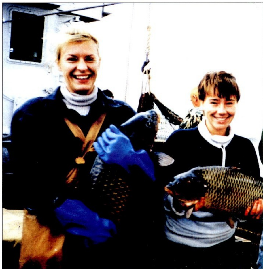
На снимке: Молодые ихтиологи в экспедиции

Режим промысла, регулируемый применением оптимального комплекса орудий лова, не наносит ущерба воспроизводительной способности популяций охраняемых видов рыб. Одновременно увеличивается добыча малоосвоенных ранее объектов лова (мелкого частика) и сокращается вылов старшевозрастных, наиболее продуктивных групп леща, судака и прочих крупночастиковых рыб (см. рисунок, В).