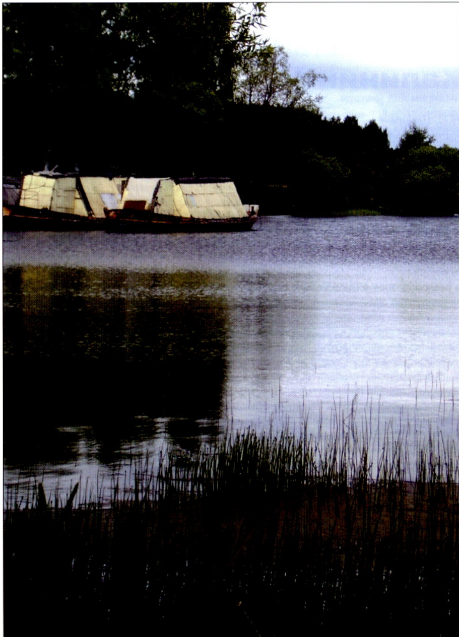
Фото 2. Рыбоводные суда на Пяловском водохранилище

В условиях России хозяйство «рыбоводный флот» находится на начальном этапе развития. Для решения вопроса с живорыбными емкостями в настоящее время можно предложить использовать специально приспособленные серийно выпускаемые живорыбные прорези, шаланды, наливные баржи, другие суда. В