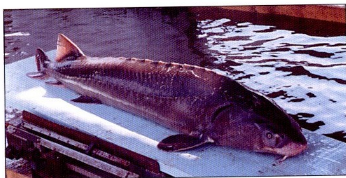
Самец сибирского осетра обской популяции