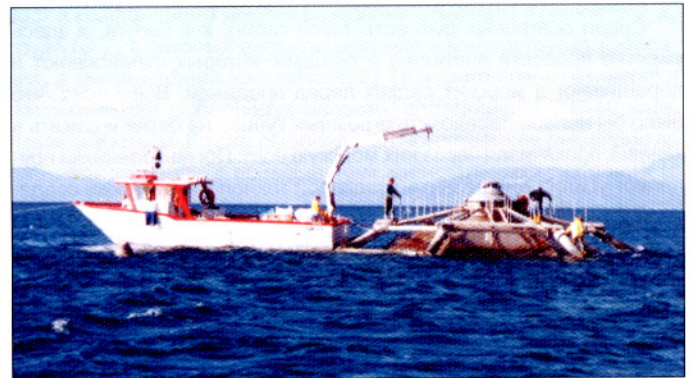
Фото 4. Судно обслуживания у поднятого на поверхность садка

Фермы, состоящие из погружных устройств типа «Садко», не являются препятствием для навигации и не контрастируют с окружающей средой (в отличие от плавучих садков). Этот тип фермы не нарушает пейзаж, что позволяет устанавливать подводные садки рядом с центрами туризма и зонами отдыха. Расходы на обслуживание фермы минимальны, садки поднимаются на поверхность один раз в две недели. Облов и другие операции по обслуживанию фермы производятся так же, как и для плавучих садков (фото 4, 5, 6). Подводная технология аквакультуры позволяет выращивать практически любые виды рыб и постоянно совершенствуется в соответствии с потребностями практики товарного рыбоводства.