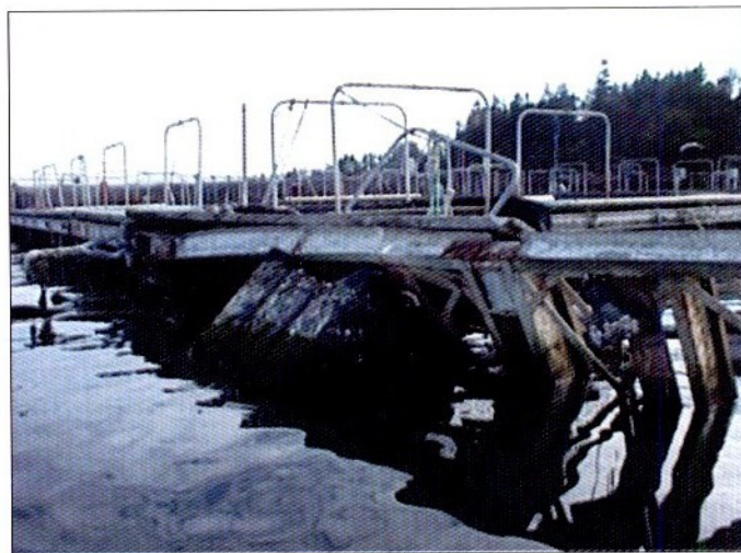
Фото 1. Типичные повреждения плавучих садков

Реальное расширение масштабов садкового рыбоводства невозможно без выхода на крупные открытые акватории, где отсутствует жесткая конкуренция между водопользователями и имеются лучшие условия водообмена по сравнению с прибрежными участками. В то же время выращивание гидробионтов на открытых водных участках связано с повышенным риском из-за штормов, и это обстоятельство не позволяет при создании морских ферм слепо копировать практику традиционных прибрежных садковых хозяйств.