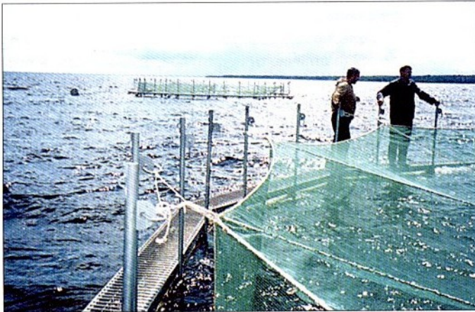
Фото 5, 6. Погружные садки серии «SADCO-SG» на Ладоге (слева) и в Сицилии (справа)

Среди осетровых рыб есть такой гигант, как белуга, и здесь уместно провести аналогию с тунцами, которых отлавливают и доращивают в морских садках перед продажей. Всем ясно, что было бы нелепо перевозить огромных тунцов на берег и сажать в каналы, прокачивая через них морскую воду. Промышленники прилагают усилия для развития садковой технологии, а также озадачили научные лаборатории проблемой получения молоди тунцов в искусственных условиях. Пока же происходит невосполнимое изъятие родительских особей тунцов из нереста для реализации через остановку в садках (без полноценного культивирования), и международные организации опять бьют тревогу. Садковое выращивание белуги – другой случай: для этой рыбы российские специалисты уже давно освоили полный цикл воспроизводства, а коммерческая привлекательность осетровых по сравнению с тунцами вообще неоспорима, учитывая фактор товарной икры.