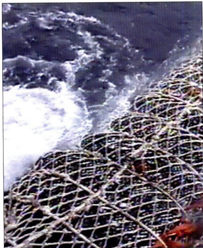
Двухслойный траловый мешок с крупным уловом на поверхности воды

Таким образом, применение двухслойного мешка без селективной вставки дает возможность в сравнении с конструкцией трехслойного тралового мешка с селективной вставкой снижать процент прилова маломерных рыб и работать на промысловых скоплениях минтая с содержанием молодежи до 60 %, не нарушая ограничительных мер и также сохраняя в улове величину рыб промысловых размеров.