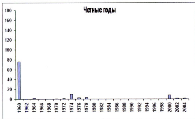
Уловы горбуши в бассейне Белого моря, тыс. экз.

площадей и грунтами. Показано, что в период мониторинга существенных изменений в миграционном поведении горбуши, характере нерестового хода и основных биологических показателей не произошло. Отмечено, что в некоторые годы (например, в 1997 г.) в отдельных реках даже в нечетные годы наблюдались поздние сроки нерестовой миграции, что должно было негативно сказаться на развитии икры. Полученные данные и основные выводы этого исследования отражены в сводке, посвященной проблеме акклиматизации горбуши на Европейском Севере России (Зубченко, Веселов, Калюжин, 2004).