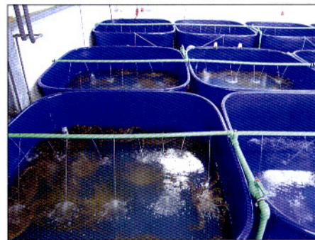
Фото 2. Бассейны для доразривания камчатского краба на береговом крабовом комплексе ЗАО «Арктиксервис» - ВНИРО

Одним из важных достижений в этой области было создание по техническому заданию ВНИРО на базе плавмастерской (ООО «Северный проект») экспериментального комплекса производственной мощностью более 2000 пререкрутов камчатского краба, которые могут содержаться в пластиковых бассейнах общей площадью 168 м 2 (фото 2). Данный комплекс на-