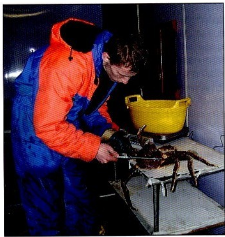
Проведение биологического анализа доращиваемых крабов

Эти работы, наравне с активными исследованиями по оценке запасов и изучению биологии крабов в естественных условиях, будут способствовать повышению экономической эффективности промышленного использования баренцевоморской популяции камчатского краба и позволят обеспечить рациональное управление ими на долгосрочной основе.