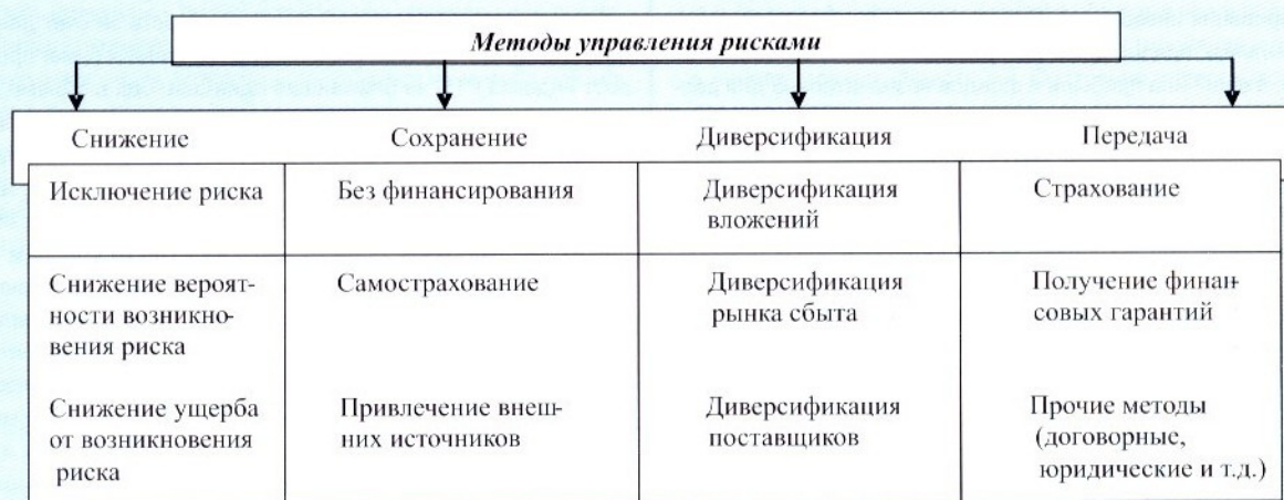
Рис. 1. Укрупненная классификация методов управления рисками

Особую важность для рыбохозяйственных организаций имеет лизинговая деятельность. Практически все приобретения нового