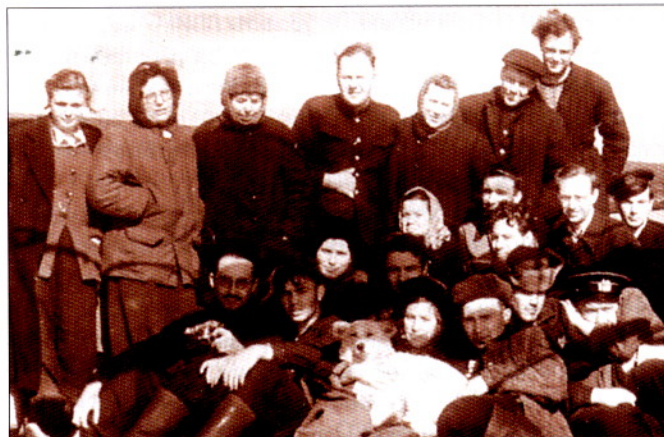
Группа участников съемки на борту НИС «Профессор Месяцев»