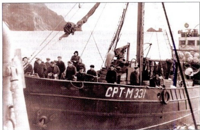
Группа участников съемки переходит с СРТ-331 «В. Беринг» на НИС «Профессор Месяцев» после завершения работ. Виден берег о. Ян-Майен

Интенсивное развитие отечественного промысла атлантическо-скандинавской сельди на огромной акватории Гренландского и Норвежского морей с участием сотен ловецких судов, плавбаз и другого флота началось вскоре после окончания второй мировой войны.