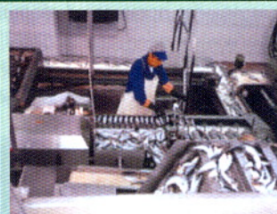
Строительство рыбоперерабаты- вающего завода, мясокомбината, Москва, Екатеринбург $ 11 300 000