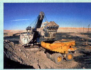
Лизинг горной техники, Магаданская область, Амурская область, Якутия $ 8 750 000