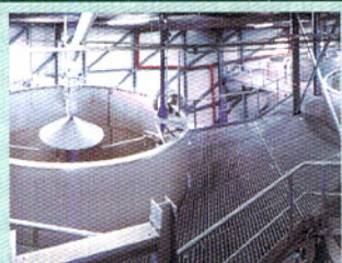
Строительство солодовен, Московская область, Воронежская область $ 60 000 000