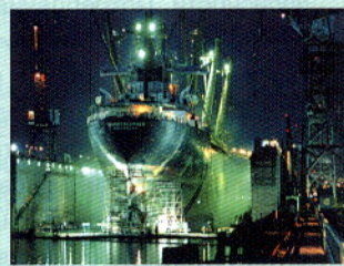
Лизинг рыболовецких, транспортных судов, Камчатка, Владивосток $ 18 100 000