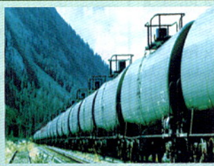
Лизинг железнодорожного подвижного состава $ 11 100 000