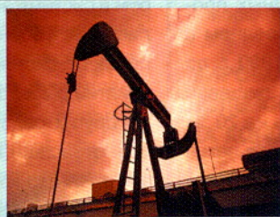
Строительство нефтеперера- батывающего завода, Якутия $ 21 000 000