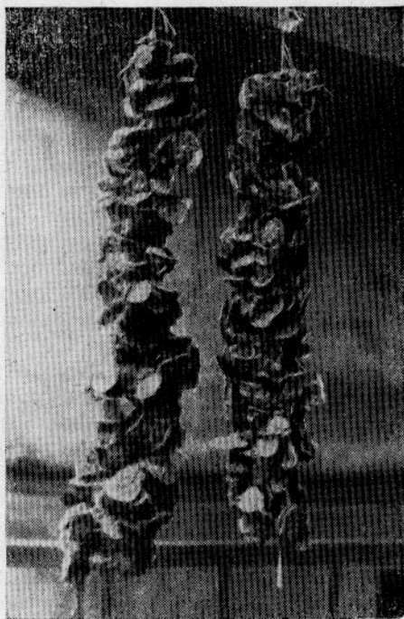
Рис. 2. Сеголетки устриц из опытного хозяйства в Джарылгачском заливе (район косы Синей, коллекторы из створок устриц, установлены 4 мая, сняты 5 октября 1971 г.)

В Каркинитском заливе среднее количество осевших устриц колебалось от 470 до 1290 экз/м 2 . Таким образом, наиболее благоприятны для сбора устричной молоди из числа изученных являются районы косы Синей и Джарылгачского маяка.