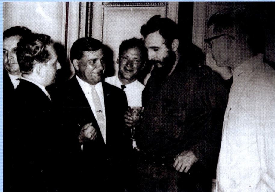
Встреча с Ф. Кастро. 1963 г.