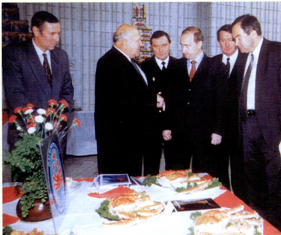
Президент России В. Путин в гостях у Дальморепродукта

Сегодня хозяйственная деятельность холдинга многопрофильна: добыча рыбы и морепродуктов, производство рыбопродукции и кон-