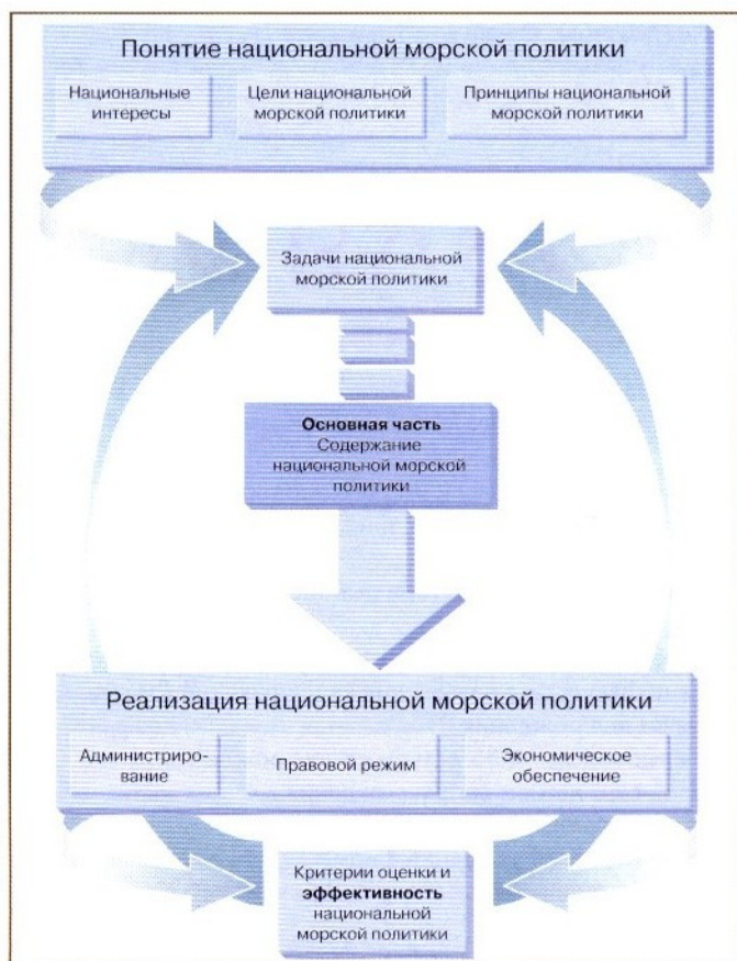
Рис. 1. Блок-схема Морской доктрины РФ

Раскрывать понятие, содержание и пути реализации российской морской политики, являющейся важнейшим аспектом ее геополитики, должна Морская доктрина Российской Федерации. Исходя из текста принятой Концепции национальной безопасности Российской Федерации (Указ Президента РФ от 24.01.2000 г., № 24) правомерно заключить, что жизненно важ-