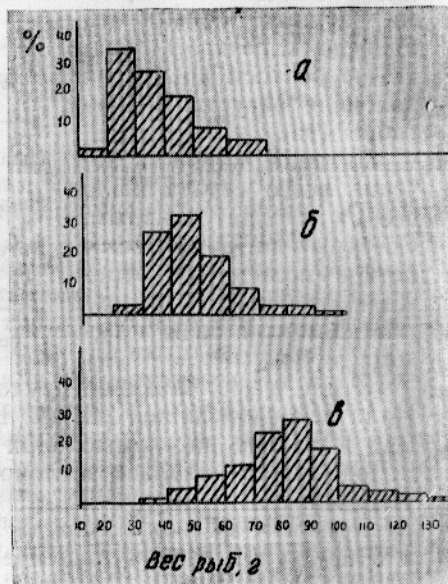
Рис. 3. Весовая изменчивость сеголетков карпа при различных условиях выращивания: а — пруд 7; б — пруды 8 и 10; в — пруды 9 и 11