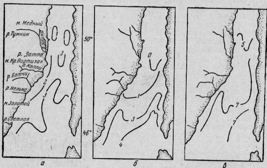
Рис. 2. Температура воды на поверхности Татарского пролива в теплом 1960 г. 5—15 мая (а), холодном 1966 г. 1—13 мая (б) и очень теплом 1967 г. 1—6 июня (в).