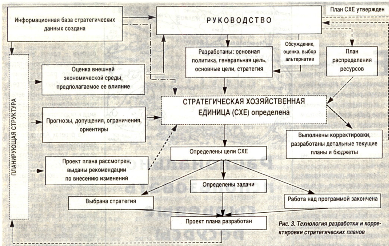
Рис. 3. Технология разработки и корректировки стратегических планов