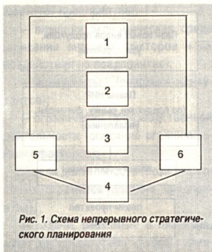
Рис. 1. Схема непрерывного стратегического планирования

– угасание системы государственной повсеместной поддержки ведения производства;