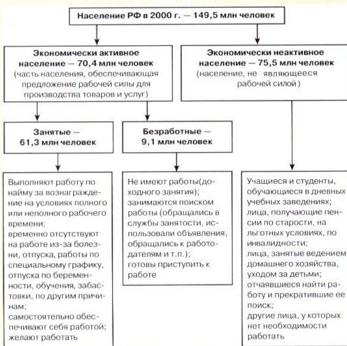
Рис. 2. Классификация занятого и безработного населения Российской Федерации по методологии Международной Организации Труда

1. Ценообразование на рабочую силу как на товар подчиняется общим экономическим законам установления цены на «товар вообще».