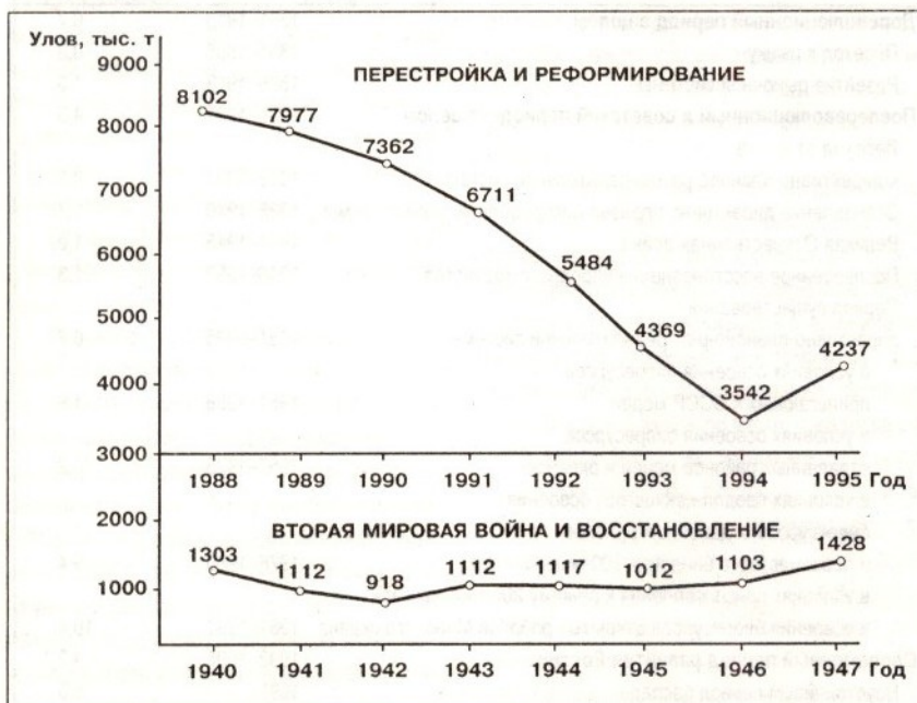
Рис. 1. Динамика уловов России во время второй мировой войны, в период восстановления и в годы перестройки и реформирования

В этой связи национальным интересам российского морского рыболовства отвечает полное использование запасов минтая, крабов Охотского моря и трески, пикши Баренцева моря только отечественными судовладельцами. Назрела необходимость объявить Охотское море лишь для рыболовных целей внутренним морем России, с полным запрещением здесь промысла иностранным рыболовным судам. Следует также незамедлительно привести промысловые усилия нашего рыболовного флота в собственной 200-мильной зоне в соответ-