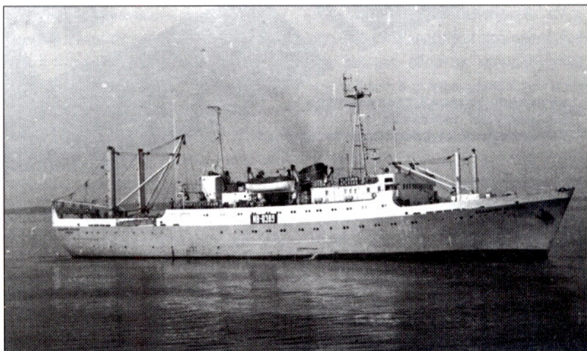
БМРТ типа "Маяковский"

Первыми объектами проектирования были Муйнакский консервный завод, небольшие холодильники в Красноводске, Оранжерейном, Мурманске. Затем институт получил весьма ответственное задание на проектирование крупнейшего в отрасли рыбообработывающего предприятия – Мосрыбокомбината. На комбинате неоднократно заменялось устаревшее оборудование, расширялись и строи-