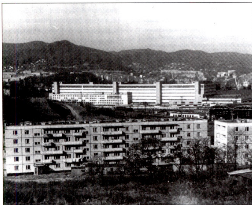
Здание жестянобаночной фабрики в г. Находка (на втором плане)

В 90-е годы широкое распространение получили холодильники из легких металлических конструкций (ЛМК). На базе изделий из ЛМК, выпускаемых АО "Техол", Гипрорыбхозом был запроектирован и осуществлен в строительстве целый ряд холодильных комплексов (Кост-