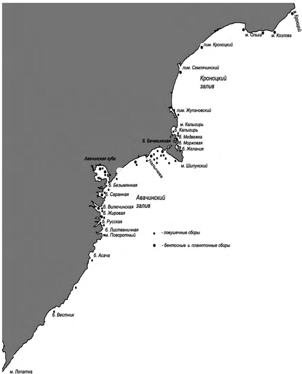
Рис. 1. Карта-схема района работ

Обработку крабов проводили по методике, применяемой ТИНРО для исследования промысловых ракообразных дальневосточных морей [Руководство..., 1979]. В дополнение к этой методике наряду с шириной карапакса измеряли и длину. Измерение длины карапакса проводилось для возможности сравнения наших данных с результатами исследования японских ученых. В Японии принято измерять длину карапакса крабов, в России – ширину карапакса.