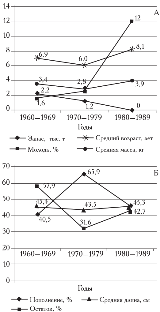
Рис. 1. Соотношение групп и размерно-возрастная структура популяции камбалы-калкан в восточной части Чёрного моря (данные за 1960–1979 гг. — Поповой, Винарик [1979]; за 1980–1985 гг. — ЮгНИРО; за 1993–1997 гг. — АзНИИРХ) [примечание по Надолинский и др., 1998]

практически полным монополистом этого вида лова, хотя в эксплуатации его запасов за рамки ареала местной популяции Турция не выходила. Использование донных тралов в совокупности с избыточной промысловой мощностью турецкого рыболовного сектора (как следствие политики государственного стимулирования рыболовства, проводимой турецким правительством в 70–80-х гг. XX в.) крайне негативно отразилось на рыбных запасах Турции.