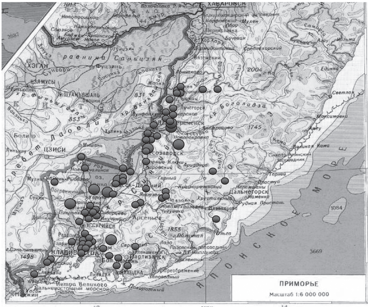
Рис. 1. Схема расположения основных рыболовных хозяйств различного размера и профиля в Приморье

При реализации программы товарные рыболовные хозяйства и водоёмы пастбищного нагула реально смогут обеспечить производство пресноводной рыбы в объёме 1,7–1,8 тыс. т ежегодно.